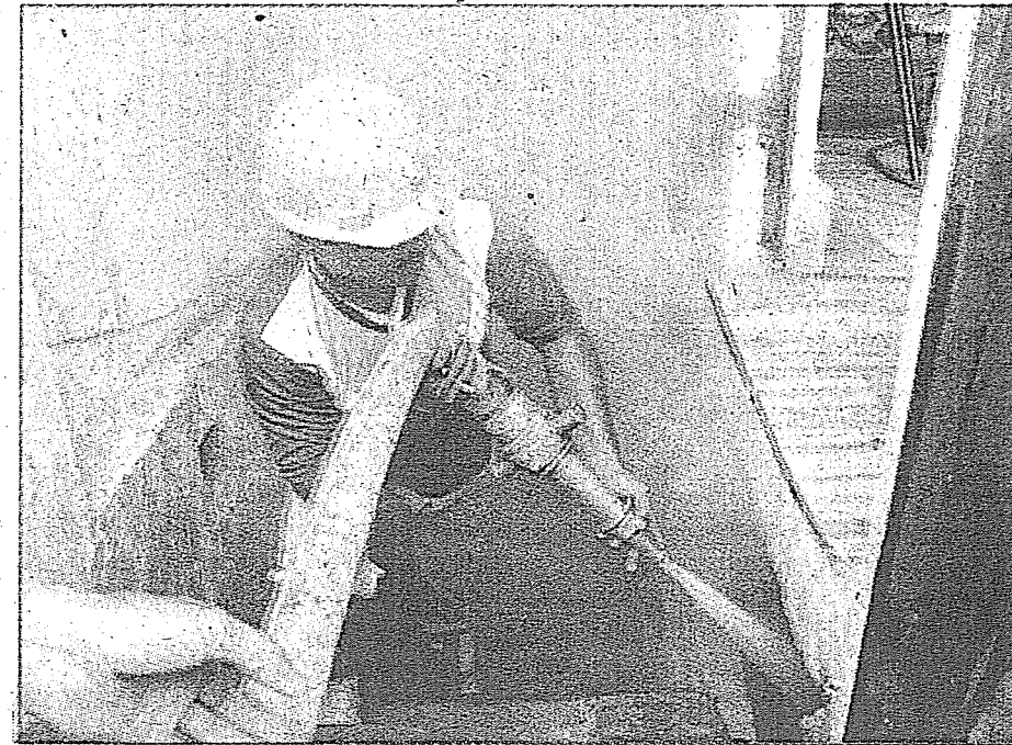
गोदाम में लगी आग बुझाते दमकलकर्मियों।

लखनऊ, मंगलवार (आज समाचार सेवा)। कई स्पेशल ट्रेनों के देरी से चारबाग रेलवे स्टेशन पहुंचने पर यात्रियों ने मंगलवार को चारबाग स्टेशन पर हंगामा किया। उनका कहना है कि रास्ते में ट्रेनों को बिना वजह रोका गया, जिससे ट्रेनें लेट हुई। इस संबंध में कई यात्रियों ने चारबाग स्टेशन पर शिकायत भी दर्ज कराई है। मिली जानकारी के मुताबिक ट्रेन सं या 04204 दिल्ली वाराणसी एक्सप्रेस करीब पांच घंटे देरी से लखनऊ पहुंची। वहीं ट्रेन सं या 05102 दिल्ली छपरा स्पेशल करीब नौ घंटे देरी से आई। लोकमान्य तिलक टर्मिनल से गोरखपुर के ब्रीच चलने वाली ट्रेन भी पौने दो घंटे देरी से चल रही थी। इन ट्रेनों के घंटों लेट हो जाने के कारण लखनऊ स्टेशन पर यात्रियों ने हंगामा शुरू कर दिया। यात्रियों का कहना था कि दोनों ही ट्रेनें अकारण रास्ते में रोकी गईं, जिससे ट्रेनें लेट हो गईं। ट्रेन लेट होने का खामियाजा इसमें सफर कर रहे मुसाफिरों ने भुगताना। इस बात से नाराज यात्री ने चारबाग स्टेशन पर अधिकारियों के पास पहुंच गए और हंगामा शुरू कर दिया। जिसके बाद यात्रियों की शिकायत दर्ज कर और उन्हें समझा बुझा कर ट्रेनों को खाना किया गया।